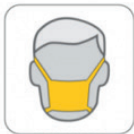
PROTECTOR NARIZ Y BOCA